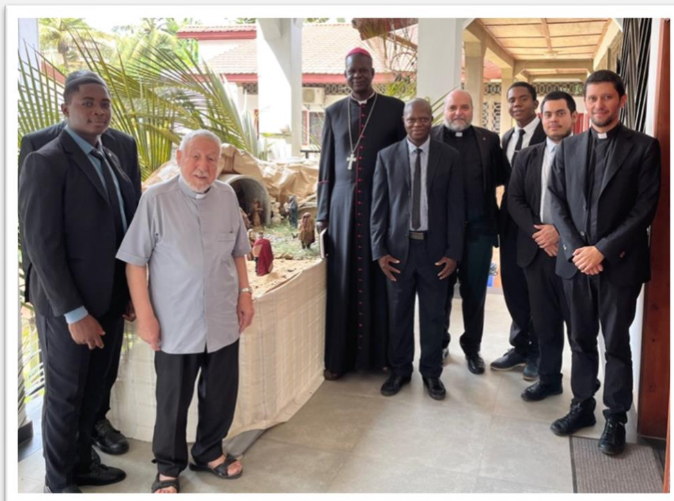
Figura 1 – I seminaristi, i formatori e l'arcivescovo Mons. KLEDA in seminario il 14 dicembre 2022, davanti al presepe.

BUON SANTO NATALE E FELICE ANNO NUOVO!!!