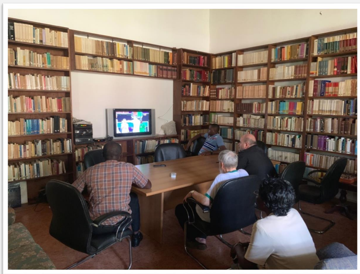
Figura 5 – La sala riunioni del seminario, con la TV dove stavamo guardando i Mondiali di calcio.

Nel frattempo sono iniziati i Mondiali di calcio in Qatar, e anche in seminario ci siamo organizzati per vedere le partite; il Camerun, purtroppo, è stato eliminato dopo la fase a gironi.