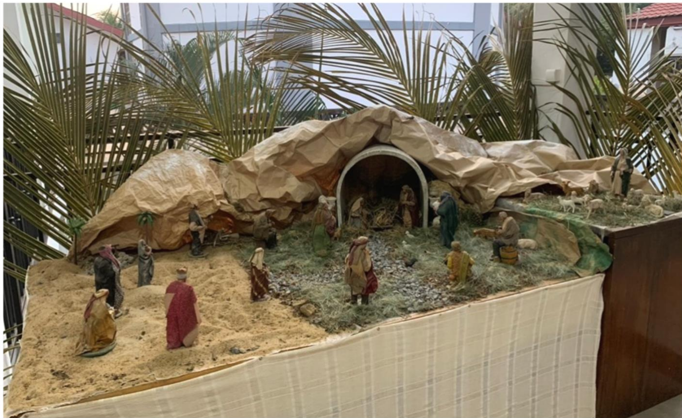
Figura 13 – Il presepio all'esterno, sotto un portico, nel seminario.

Abbiamo quindi salutato Paolo e Stella, partiti il 10 dicembre durante la notte, e da lunedì 12 ci siamo dedicati a terminare la preparazione del Presepio (ne abbiamo fatti 3, uno esterno, uno in cappella e l'altro in refettorio, con l'albero di Natale). In questo periodo, infatti, vengono a visitarci dei bambini e dopo Natale i giovani di diverse parrocchie faranno da noi una convivenza con i catechisti itineranti del Camerun. La tradizione del presepio, infatti, che il papa Francesco ha invitato a non dimenticare, ci aiuta a trasmettere la fede ai giovani, a contemplare l'opera della salvezza, il Signore che si è fatto carne, piccolo, umile e a lasciare che si incarni anche in noi, tramite l'ascolto della Parola di Dio e i sacramenti, e che da piccolo bambino cresca in noi, fino al livello della fede adulta, fino a innestare nelle nostre vite l'amore di Cristo crocifisso, capace di donarsi e di perdonare i nemici e i suoi uccisori.