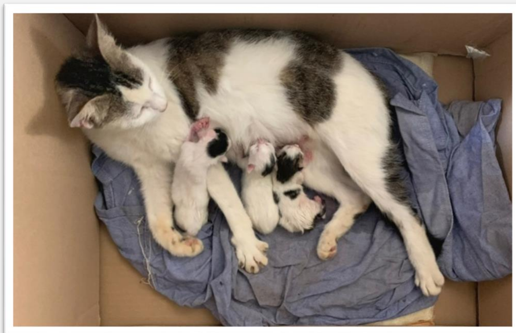
Figure 14, 15 e 16 – In alto i seminaristi che puliscono le taniche per l'accumulo dell'acqua, dentro e fuori. In basso la gatta con i suoi gattini appena partoriti.