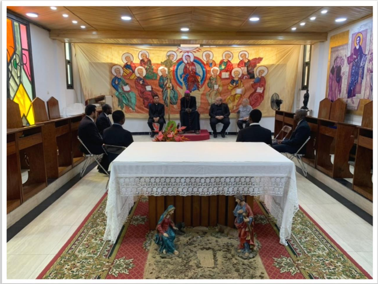
Figura 17 - Il seminario con il vescovo in cappella, durante il dialogo che abbiamo avuto in occasione della sua visita pastorale.

Vorremmo rinnovare i nostri sentiti auguri per un Santo Natale e per un gioioso anno nuovo. É vero che ci sono tanti problemi nel mondo, la guerra tra Ucraina e Russia, le tante guerre che fanno meno scalpore, come quella nelle regioni del nord-ovest e sud-ovest del Camerun, i problemi economici ecc., ma il Signore viene, come Principe di pace, viene per portarci dall'alto la sua vita nuova, la capacità di perdonare e di essere operatori di pace, di valutare con distacco i beni che passano, per fissare lo sguardo ai beni eterni, alla vita piena che ci attende in cielo.